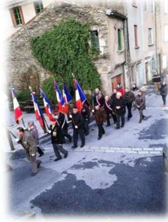
Défilé avec porte drapeaux