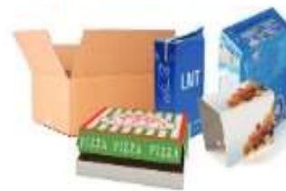
Tous les cartons et les briques alimentaires : cartons bruns, colorés... même s'ils sont abîmés