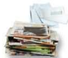
Tous les papiers : journaux, publicités, cahiers, enveloppes, catalogues... même les plus petits