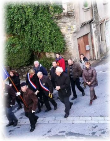
Défilé avec autorités