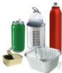
Tous les emballages métalliques : boîtes de conserve, canettes, aérosols, barquettes aluminium... même s'il reste des salissures