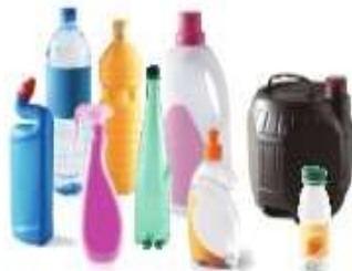
Tous les flaconnages en plastique : bouteilles, flacons et bidons avec leur bouchon