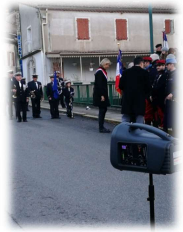
Rallye Castrais, Mme la députée